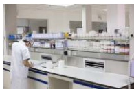
■ 实创科技研发中心

“科技演绎完美，实力创造奇迹”！实创将秉承新时代的工匠精神，不断创新成长，强化企业文化与团队建设，努力成为客户最值得信赖的长期合作伙伴。