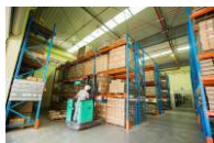
■ 实创科技成品仓库